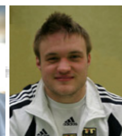
2. PI. EM U17 3. PI. EM U20 3.PI.WM U20