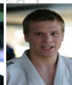
5. PI. EM U20 5. PI. WM U20