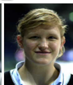
3. PI. EM U17