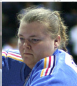
1. PI. EM 3.PI. EM (2x)