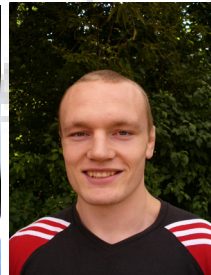
3. PI. EM 3.PI.Kano Cup 1.PI. EM U23 3.PI. GS Paris