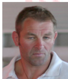
3. PI. EM 1.PI.TeamEM (2x) OS Teilnahme 92/96